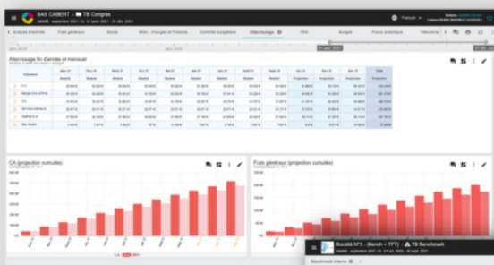
Budget, écarts avec le réalisé et atterrissage