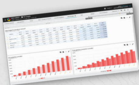
Budget, écarts avec le réalisé et atterrissage

Des indicateurs clairs et pertinents permettent une analyse approfondie de la réalité sociale et RH , au cœur de l'activité d'une entreprise.