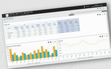
Comparaison à une population interne au cabinet (benchmark)