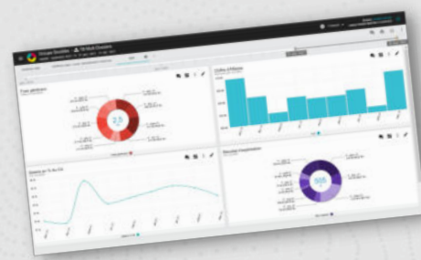
Approche multi-dossiers (consolidation)